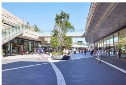
リボンストリート①