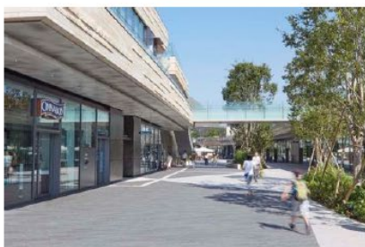
リボンストリート②